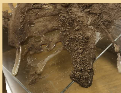
練乳とココアで溶岩を再現