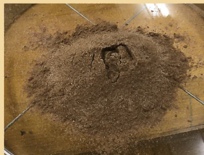
ココアでカルデラを再現