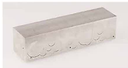
《Mr.阿からのメッセージ第4信》1996年