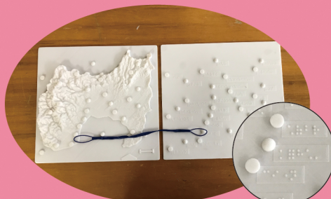
点字でわかる地図