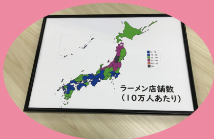
くらしがわかる日本地図