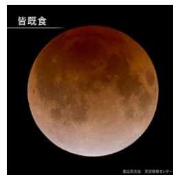
皆既食となった月は、「赤銅色(しゃくどういろ)」と呼ばれる、赤黒い色に見えます。

1月31日、全国で皆既月食を観察することができます。月食が起ると、月がいつもより黒っぽくみえたり、欠けているように見えます。